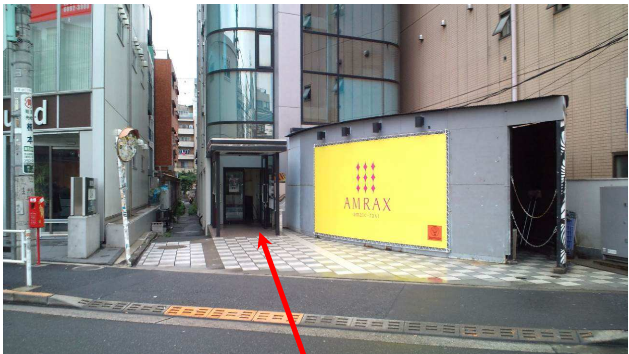
オフィスビル入口